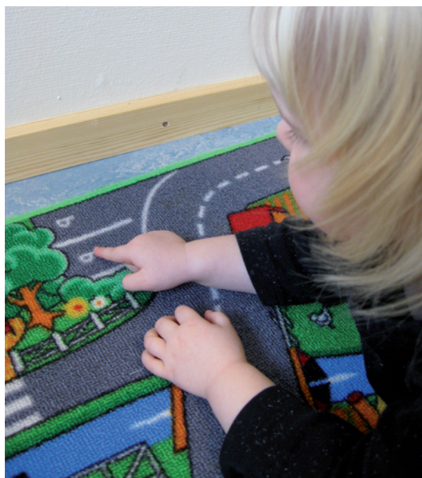
Där står det pappa! (Pappa heter också Pär)...pekar på en parkeringsskylt

Läsutvecklingen börjar inte den dag barnet kan uttala eller skriva en bokstav, utan långt tidigare. Att känna igen symboler (många små barn kan tidigt t.ex. "läsa" M-skylden som står för MC Donalds), känna igen sitt namn, förstå att det som står skrivet också går att sägas. Det är pusselbitar som är viktiga för det fortsatta läsandet.